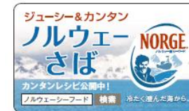
D-05 商品ステッカー (30×50mm 1巻500枚)