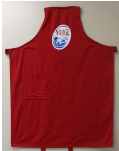
A-02 店頭用デモエプロン