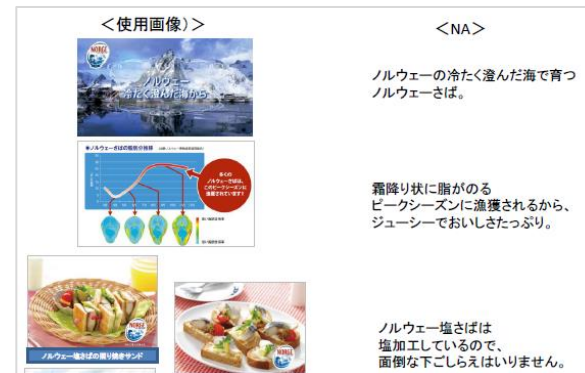
D-08 ノルウェー塩さば レシピ紹介ビデオ (30秒)