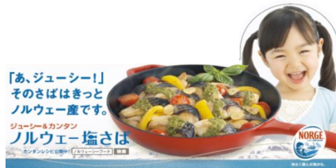
D-04 シェルフトーカー（前面 70×200mm）