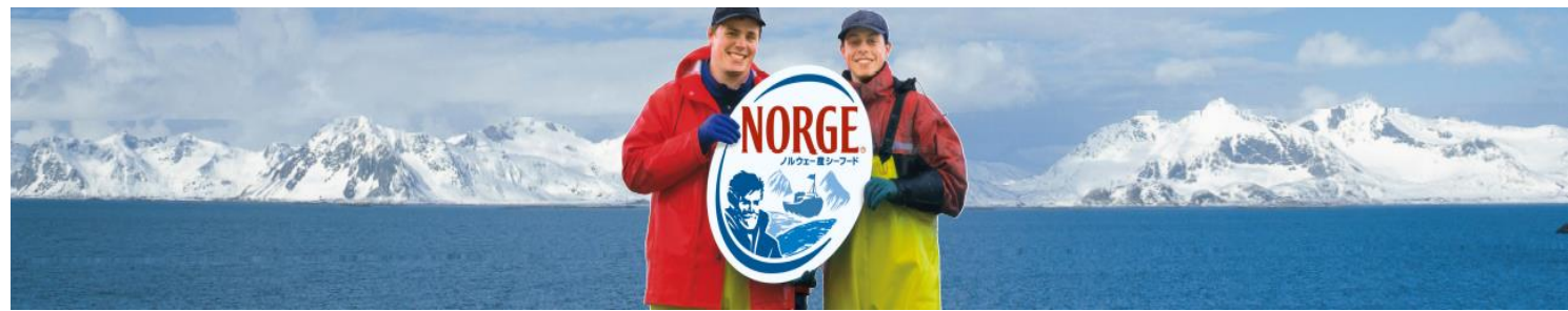
A-01 ラウンドシート (500×2,000mm)