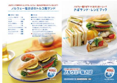
D-07 レシピリーフレット (5メニュー A6サイズ100枚束)