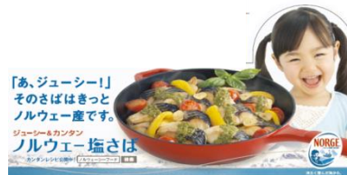
D-04 シェルフトーカー (前面 70×200mm)