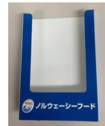
B-03 レシピホルダー (フック付)