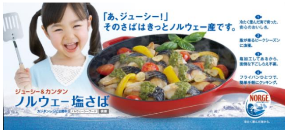
D-01 トップボード (263×594mm)