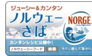
D-05 商品ステッカー（30×50mm 1巻500枚）