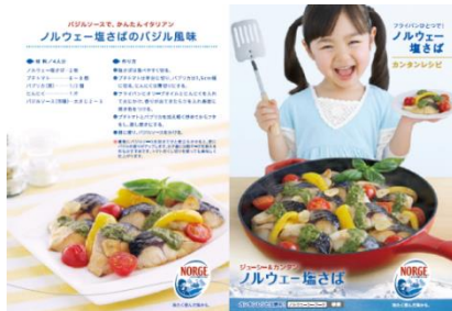
D-02 レシピリーフレット (6メニュー A6サイズ100枚束)